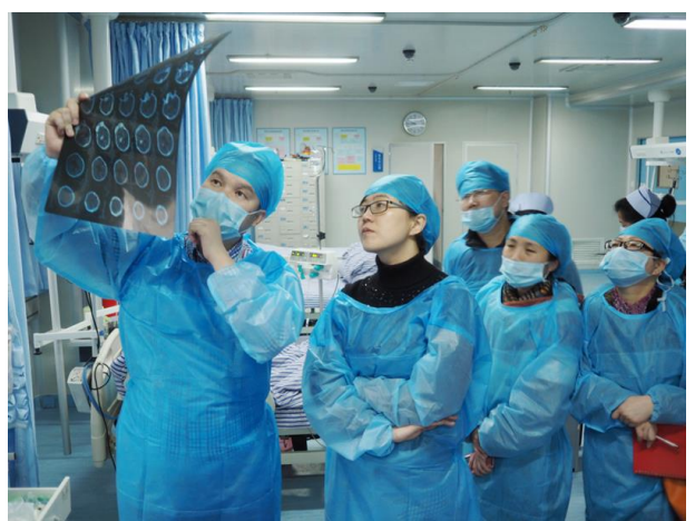
湘潭市第三人民医院教学查房